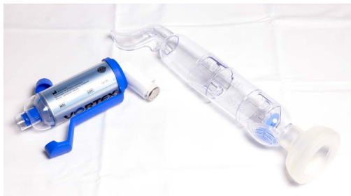
Mynd 3. Úðabelgur.

Í einstaka tilfellum getur verið nauðsynlegt að nota úðabelg með innúðalyfjum (mynd 3).