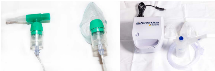
Mynd 4. Loftúði og loftúðavél.

Til eru innöndunarlyf í fljótandi formi sem eru gefin í loftúða. Hægt er að nota þessa gerð af lyfjum í heimahúsi eða stofnunum með þar til gerðum innúðatækjum (mynd 4).