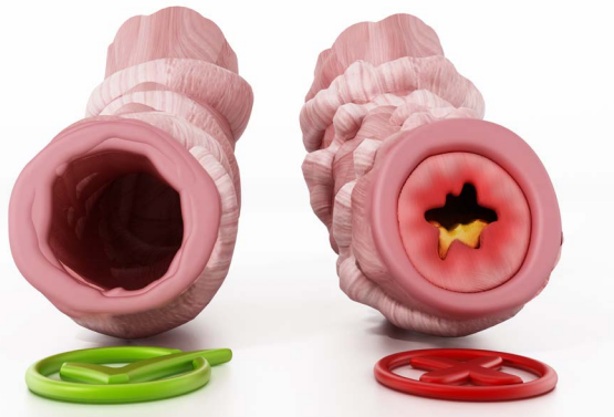
Mynd 5. Eðlileg og bólgin berkja.

Lyfin geta einnig verið samsett til dæmis blanda af langverkandi og stuttverkandi berkjuvíkkandi lyfjum með eða án barkstera. Þau innihalda tvö eða þrjú virk lyf. Þessi lyfjameðferð gagnast fólki með astma og langvinna lungnateppu vel og getur einfaldað meðferðina hjá þeim. Berkjuvíkkandi og bólgueyðandi lyf sem eru samsett komast betur til lungnanna og hafa því meiri áhrif.