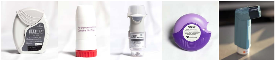
Mynd 2. Nokkrar tegundir af innöndunarlyfjum.

Til eru margar tegundir af lyfjum og innöndunartækjum sem hafa ólíka eiginleika og mismunandi virkni (mynd 2).