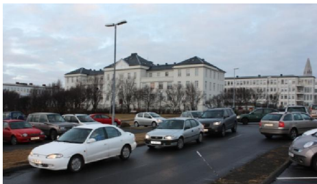
Mynd 1 Vaktaskipti við Landspítalann við Hringbraut.

Stofnkostnaður við hefðbundið bílaplan fellst m.a. í malbiki, jarðvegsskiptum, frárenniskerfi, lýsingu og gróðri. Bílastæðahús eru margfalt dýrari (~8 sinnum dýrari). Ofan á bætist svo kostnaður vegna reksturs og viðhalds svo sem vegna snjómoksturs, þrifa, lýsingar, gróðurs og hugsanlega öryggisvöktunar.