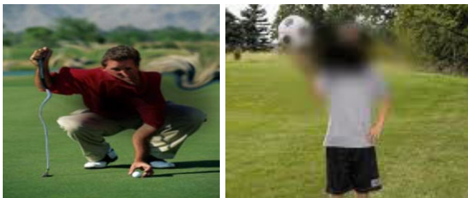
Miðjusjón skerðist við hrörnun í augnbotnum

Við vota hrörnun myndast nýjar æðar í augnbotni sem valda bjúg og blæðingum. Einkennin eru skyndilegar breytingar á sjón sem fela m.a. í sér sjóntap eða brenglun á sjón þannig að beinar línur virðast bognar og aflagaðar. Mikilvægt er að meðhöndla sjúkdóminn sem fyrst til að koma í veg fyrir að hann þróist enn frekar og valdi óafturkræfum skemmdum.