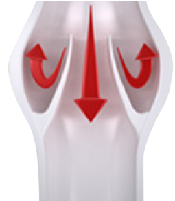
Biluh loka í bláæð