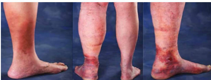
Einkenni bilunar í bláæðum

Fyrstu einkenni bilunar í bláæðum er vægur bjúgur sem kemur á fætuna yfir daginn en hverfur á nóttunni. Ef ástand æðanna versnar er bjúgur viðvarandi allan sólarhringinn. Ef ekki er brugðist við versna einkennum enn frekar með sárum, exemum og varanlegum brúnleikum litabreytingum í húð.