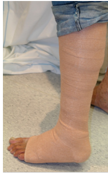
Vafningar sem fara vel