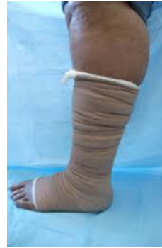
Vafningar sem fara illa