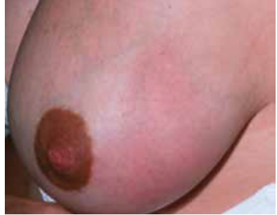
Mynd 1. Roði og bólga í brjósti