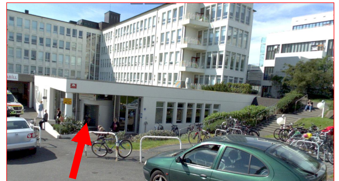
Móttaka sýna. Aðkoma frá Eiríksgötu

Ef með þarf má hafa samband á dagvinnutíma í síma 543 5650 og utan dagvinnutíma í síma lífeindafræðings á vakt 824 5208